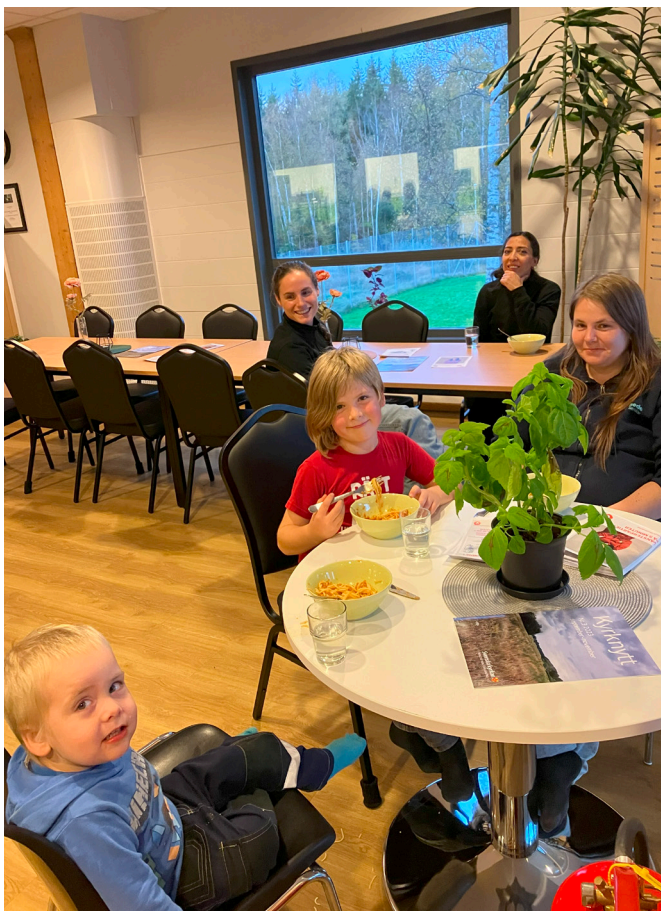
Kvinnojuren tillfälligt i bakgrunden