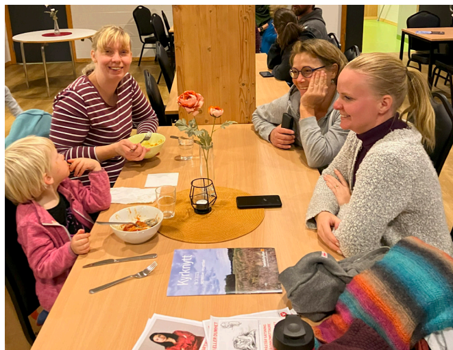
Nooshi var med oss.