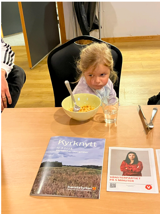
Jag är inte alls blyg