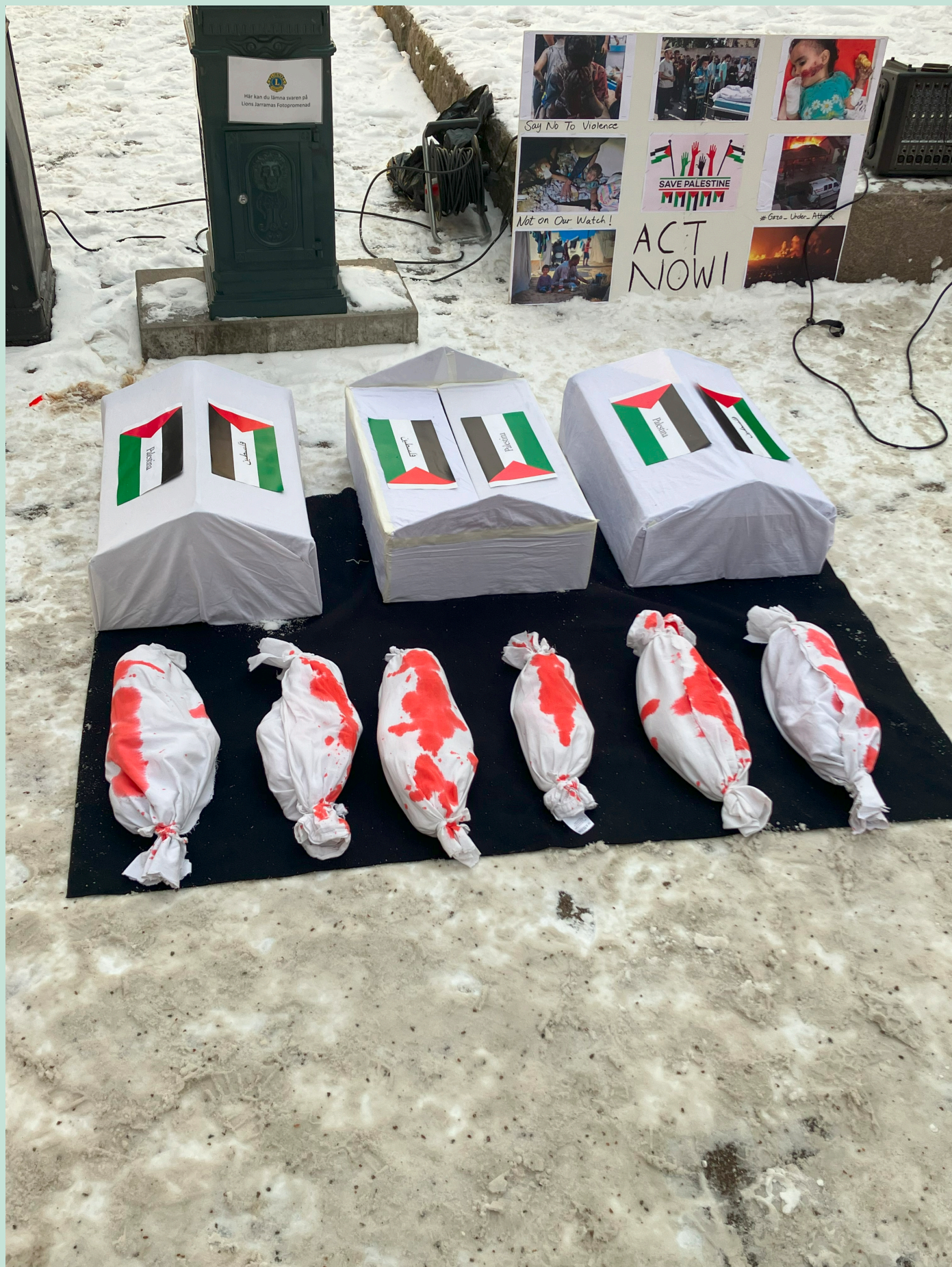
En makaber installation på Klaipedaplatsen under manifestationen för Fred i Palestina. För varje sund människa måste den vara tankeväckande.